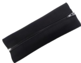
③付属アンダーソンコネクタプロテクター