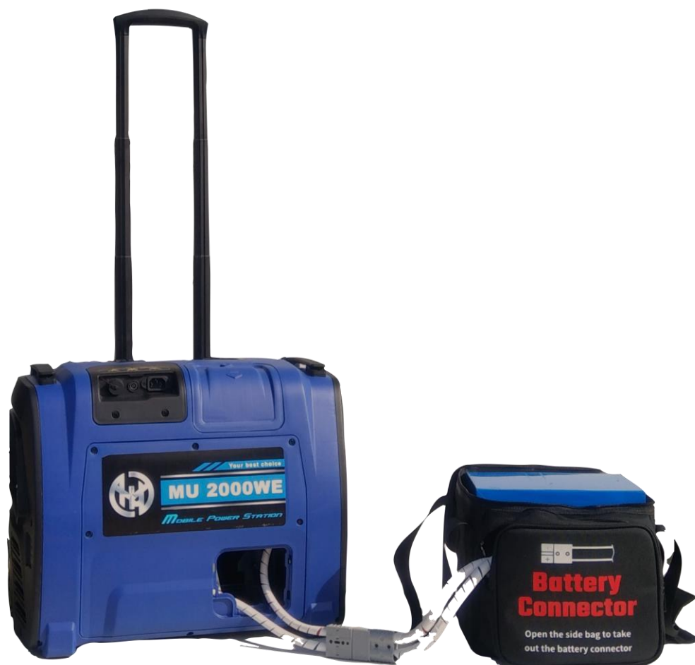
LifePO4 80AH バッテリー