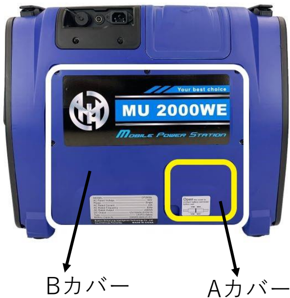
②アンダーソンコネクタ