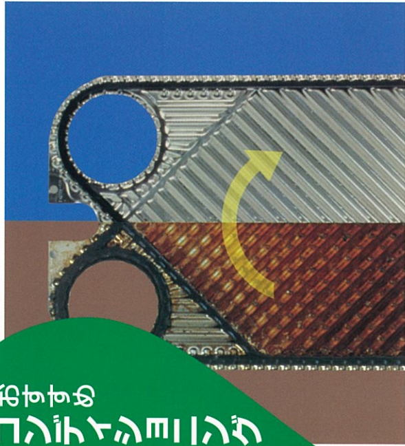
リコントエンジニア 前 リコントエンジニア 後